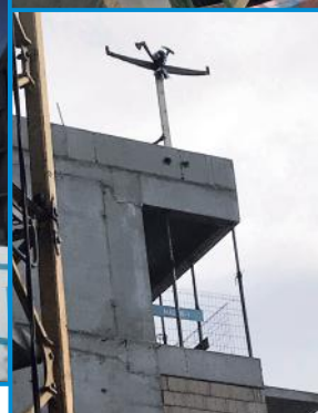
Wiecha na Ligii